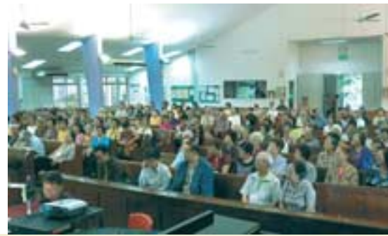
5月18日喜福乐龄聚会

首个筹款活动就是6月14日举行的《鬼马家族音乐剧》- 圣公会慈善晚会，希望藉此晚会筹得50万元，作为自闭症中心开业运作经费。