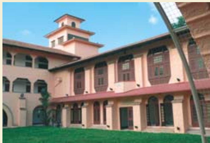
圣公会教区中心，复活堂、圣安德烈学前教育中心、和青年活动中心将设在其内。

心。众多的设施中还包括游泳池和许多运动设施。它将成为一个充满活力的集中区，涵括教育、青年、和教会的许多活动。