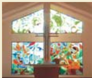
新近翻新好的荣升堂内部(上)和外观(下)

第二个加入的牧区是圣灵堂。它的前身是1980年成立的黄埔基督中心，在黄埔区的一所房屋聚会。1984年增加华文主日崇拜，后于1986年搬迁到波东巴西，命名为圣