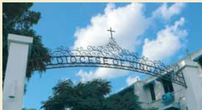
圣公会教区中心入口