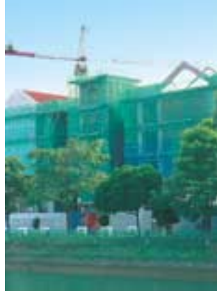
兴建中的圣安德烈初级学院，圣灵堂在其内。